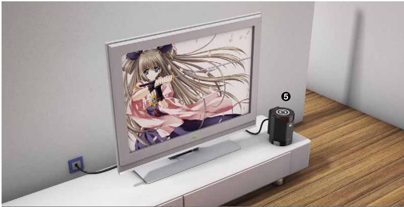
5 Exemple de configuration : boîtier multimédia TViX HD M-5000U de DVico avec disque dur 400 Go