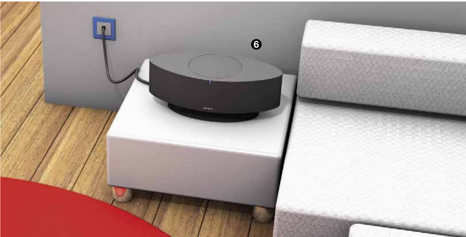
6 Exemple de configuration : microchaîne Sony, réf. NAS-CZ1, dotée d'une connexion réseau