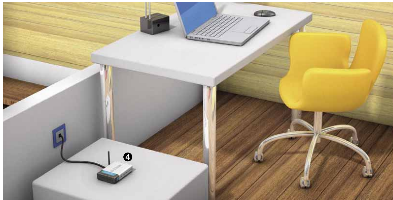
4 Exemple de configuration : point d'accès Wifi D-Link 6700AP